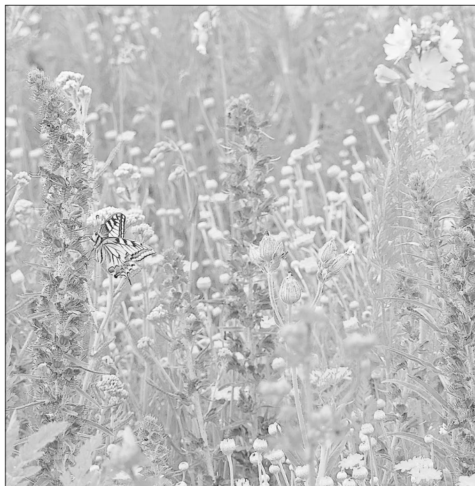
Schwalbenschwanz ( Papilio machaon ) auf Gewöhnlichen Natterkopf ( Echium vulgare )

Ziel des VIA Natura 2000 Bundesprojektes ist es, neue Feldraine entlang von bestehenden Wegen oder zwischen zwei Ackerschlägen in den Agrarlandschaften dauerhaft anzulegen. Die Projektflächen werden auf Basis umfassender, flurstücksgenauer Biotopverbundplanungen ausgewählt, um auch die Vernetzung zwischen Natura 2000- und anderen Schutzgebieten zu verbessern.