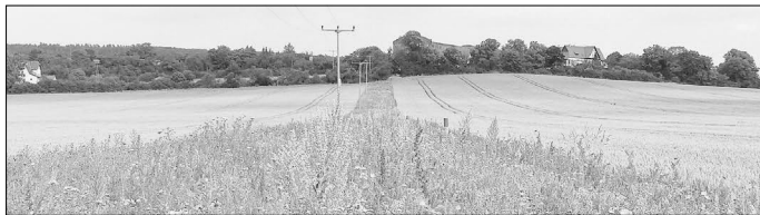
Blühaspekt eines neu angelegten Felddrains bei Heygendorf im ersten Standjahr

„Hervorheben möchte ich den Einsatz der Stadt an der Schmücke, der Stadt Artern sowie der Gemeinde Kyffhäuserland, die im Rahmen des Bundesprojektes durch die Bereitstellung und langfristigen Sicherung von Projektflächen, einen wesentlichen Beitrag zur Wiederherstellung einer strukturreichen Agrarlandschaft in der Region beitragen. Ein besonderer Dank für die umfangreiche Unterstützung bei der diesjährigen Frühjahrsansaat und der zukünftigen Pflege der neu entstandenen Felddrainage gilt den involvierten Landwirtschaftsbetrieben aus Oldisleben und Braunsroda“, so Ehrhardt weiter.