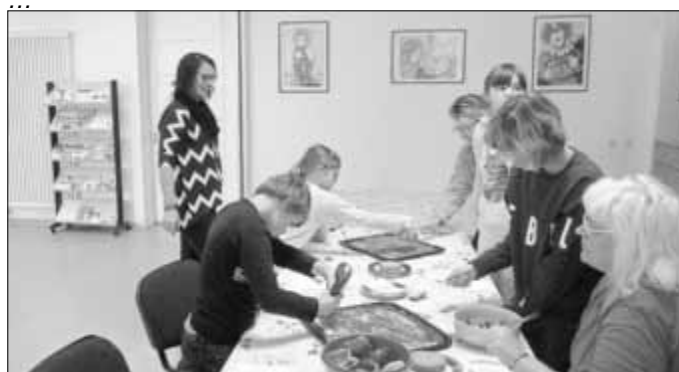
Gemeinsam ein Mittagessen vorbereitet, mit Rezept für zu Hause ...