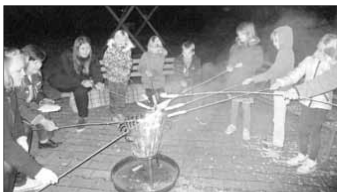
... zur Geschichte am Feuerkorb durfte das Stockbrot natürlich nicht fehlen