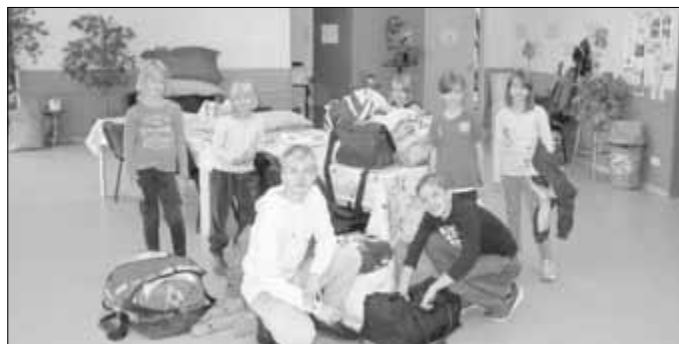
... alle kamen mit „Sack und Pack“