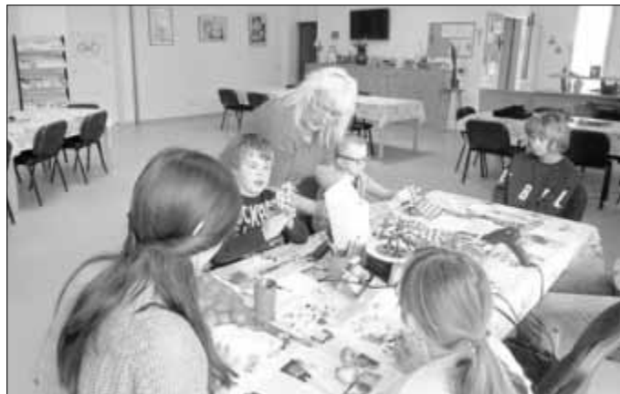
Es wurde gebastelt, hier mit Zwiebeln passend zur Jahreszeit