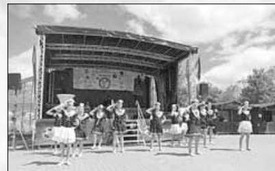
Cheerleader des ATV - Destiny's Dancers