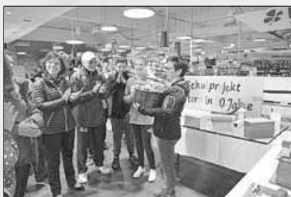
Schulprojekt - Wie sieht die Jugend Artern in 30 Jahren

Die Arterner Streetball-Turniere gehören der Vergangenheit an - aber der Verein, der 1. BSV '94 Artern lebt. Er hat Arterner Sportgeschichte geschrieben und die Vereinslandschaft des Arterner Sports ein viertel Jahrhundert mit geprägt.