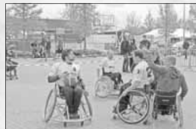
Turnier der Rollis