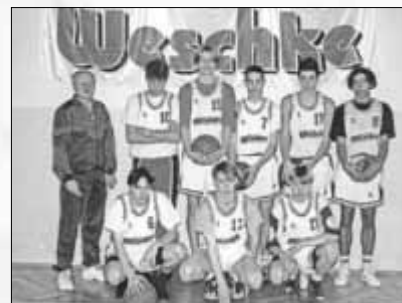
Der 1. Trikotsatz von Möbel Weschke 1995